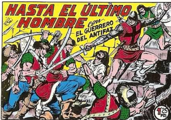
PORTADA DEL NUMERO 260