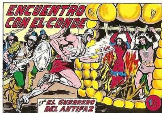
PORTADA DEL NUMERO 261