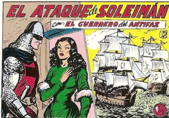
PORTADA DEL NUMERO 256

PORTADAS ORIGINALES DE LOS CUADERNOS IN- CLUIDOS EN EL INTERIOR.