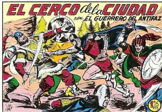
PORTADA DEL NUMERO 258