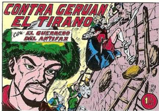
PORTADA DEL NUMERO 259