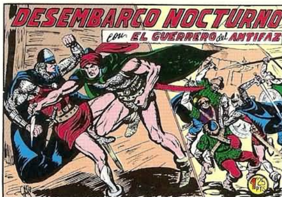
PORTADA DEL NUMERO 257

PORTADAS ORIGINALES DE LOS CUADERNOS IN- CLUIDOS EN EL INTERIOR.